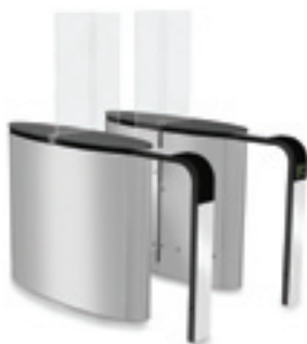
SmartLane 901 avec anti-fraude élevée en entrée Encombrement* : 1600 x 1200 mm (63" x 47")