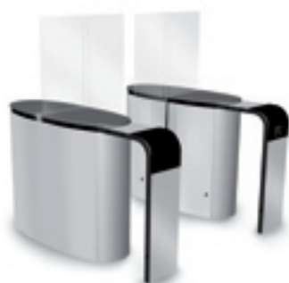
SmartLane 911 avec anti-fraude élevée en entrée Encombrement* : 1600 x 1800 mm (63" x 70 7/8 " )