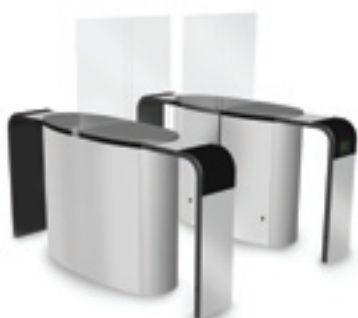
SmartLane 912 avec anti-fraude élevée en entrée/sortie Encombrement* : 2000 x 1800 mm (78 3/4 " x 70 7/8 " )