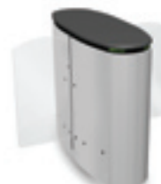
SmartLane 910 Twin à empreinte compacte Encombrement* : 1200 x 1450 mm (47" x 57")

Largeur de passage : 2 x 500 mm (19 2/3 " )