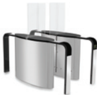
SmartLane 902 avec anti-fraude élevée en entrée/sortie Encombrement* : 2000 x 1200 mm (78 3/4 " x 47")