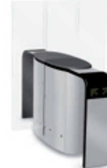
SmartLane 912 Twin avec anti-fraude élevée en entrée/sortie et empreinte compacte Encombrement* : 2000 x 1450 mm (78 3/4 " x 57")