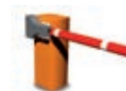
Système de regondage automatique