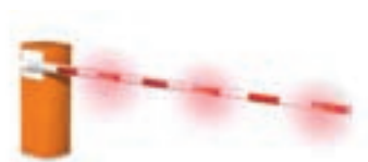
Eclairage de lisse