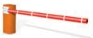
Lisse Protecta en fibre de carbone