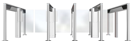
SL 950 + SL 944 + SL 945 Twin

Note: Les rambarde d'extrémités, représentées dans l'illustration ci-dessus, ne font pas partie du produit SlimLane 945 Twin.