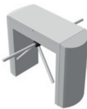
TR 492R Dubbele doorgang Ronde afwerking