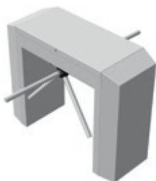
TR 492 Dubbele doorgang Rechthoekige afwerking