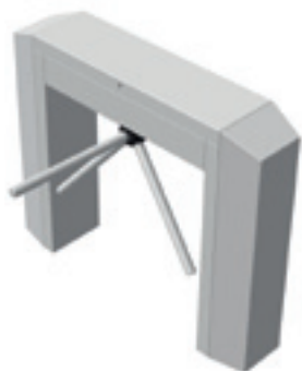
TR 490/491 Enkele doorgang Rechthoekige uitvoering Met/zonder neerklapbare arm