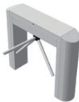
TR 490R/491R Enkele doorgang Ronde uitvoering Met/zonder neerklapbare arm